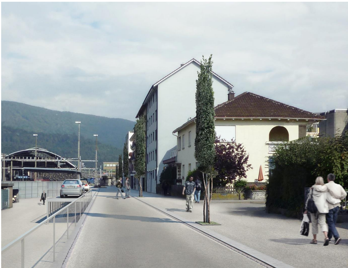
Abb: Visualisierung Variante mit Rankobelisken (Projekt Bahnhof Ost, 2010)

Die Tannwaldstrasse wurde 2012 im Rahmen des Projekts Bahnhof Ost umgestaltet. Städtebaulich und klimatisch ideal wäre eine Baumreihe am westlichen Strassenrand. Dafür fehlte aber damals wie heute der Platz. Auf eine Baumreihe am östlichen Rand der Gehfläche musste mit Rücksicht auf den Leitungsbau verzichtet werden. Stattdessen wurde eine Reihe Rankobelisken geprüft, aber verworfen, weil sie keinen Schatten spenden, zudem den Bewegungsraum einschränken und für sehbehinderte Menschen ein Hindernis darstellen.