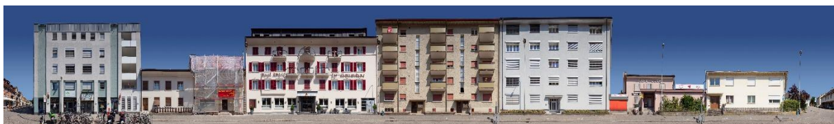
Abb: Ansicht Tannwaldstrasse (2010)

Möglichkeiten gäbe es auch auf privater Seite. Die Fassaden könnten teils begrünt werden, was zwar keinen Schatten, aber eine gewisse Kühlung bewirken könnte. Die Vorzonen könnten viel stärker begrünt werden und es dürfen zudem Sonnenstoren für die Aussennutzung realisiert werden.