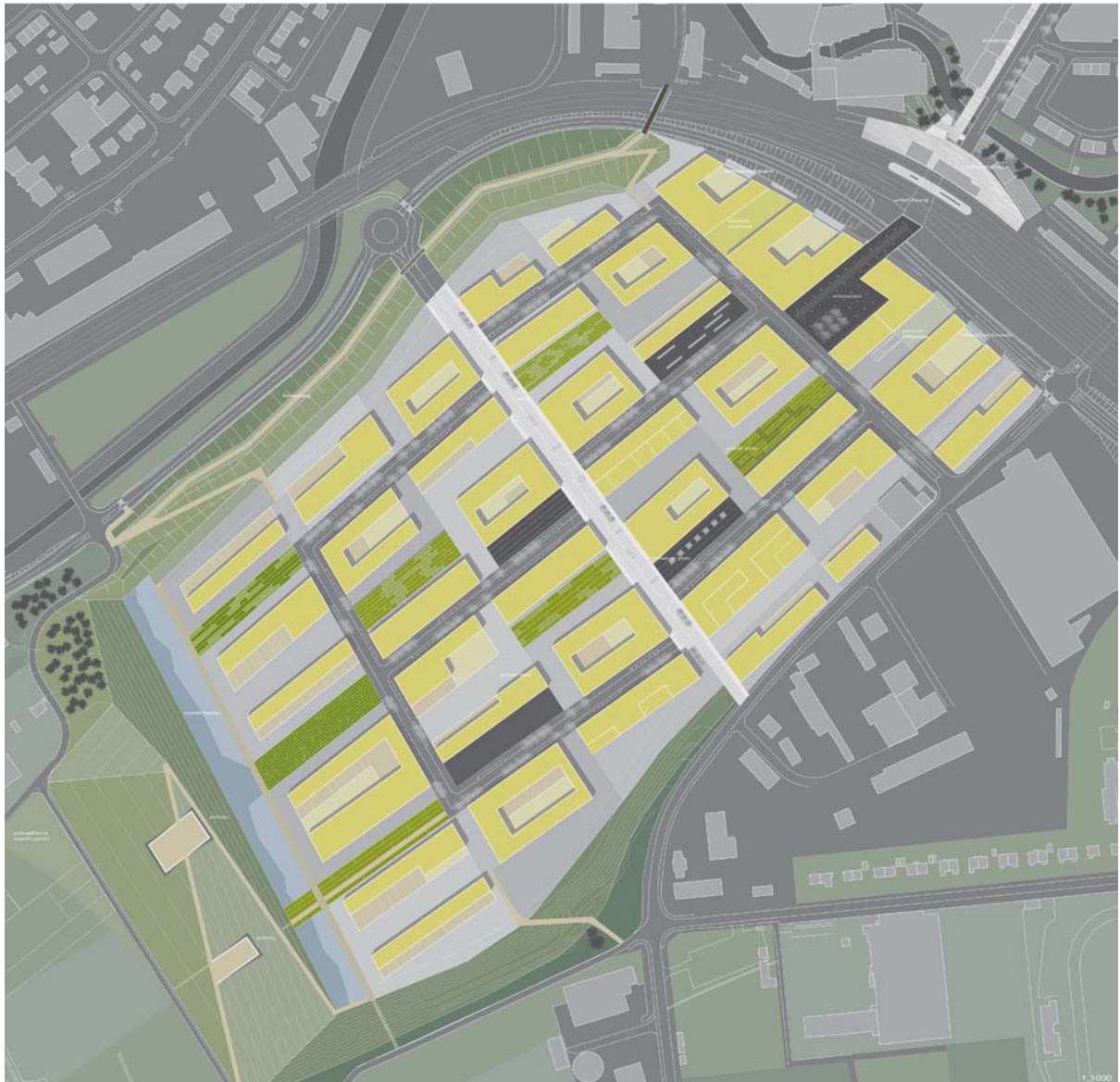
Das städtebauliche Konzept eureka